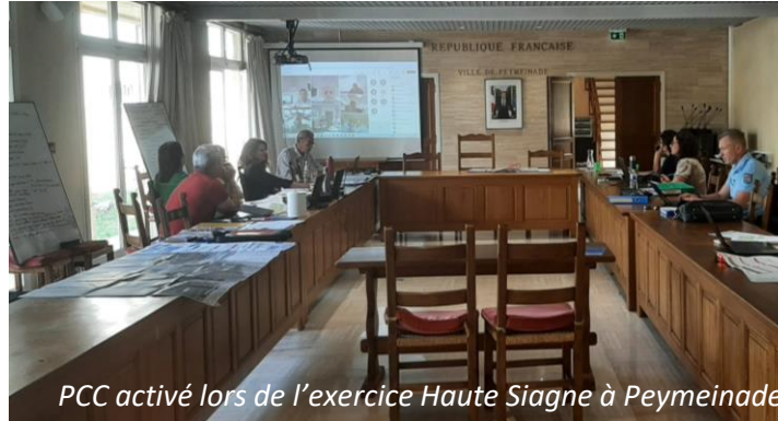
COD activé pour les exercices Siagne à la Préfecture