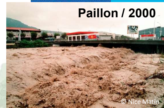
Pailion / 2000