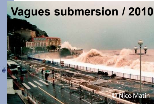
Vagues submersion / 2010