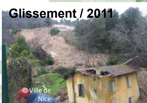
Glissement / 2011