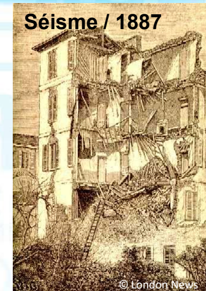
Séisme / 1887