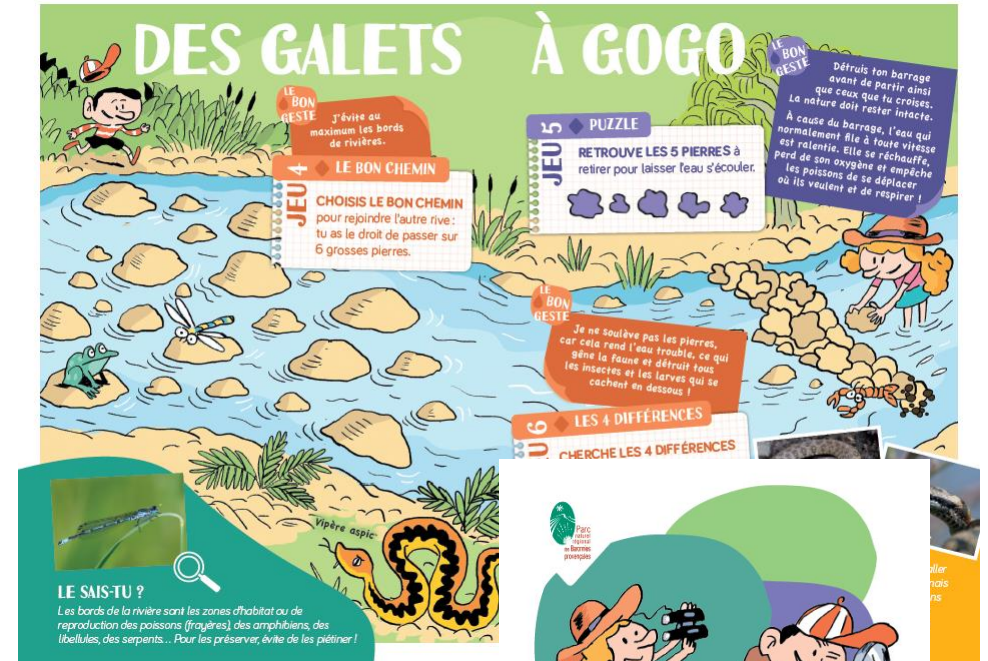
Exemple de livret-jeux du Parc