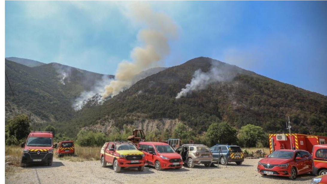
Feu de forêt à Chanousse (05), août 2023, environ 140 ha parcourus