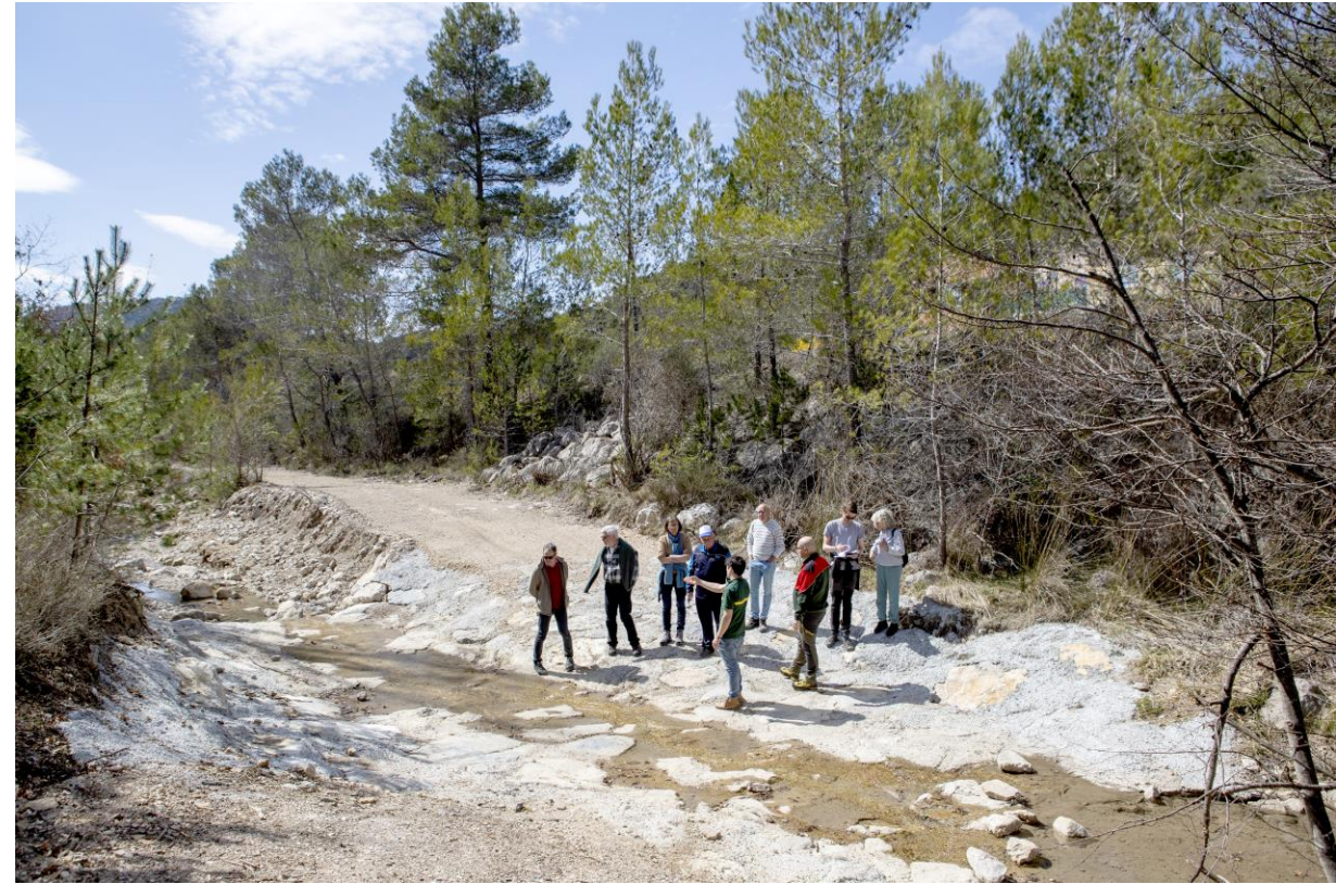
Piste et passage à gué réalisés suite à l'étude pour la Mise en sécurité du massif de Pierrelongue (GIRN 2017-2020)