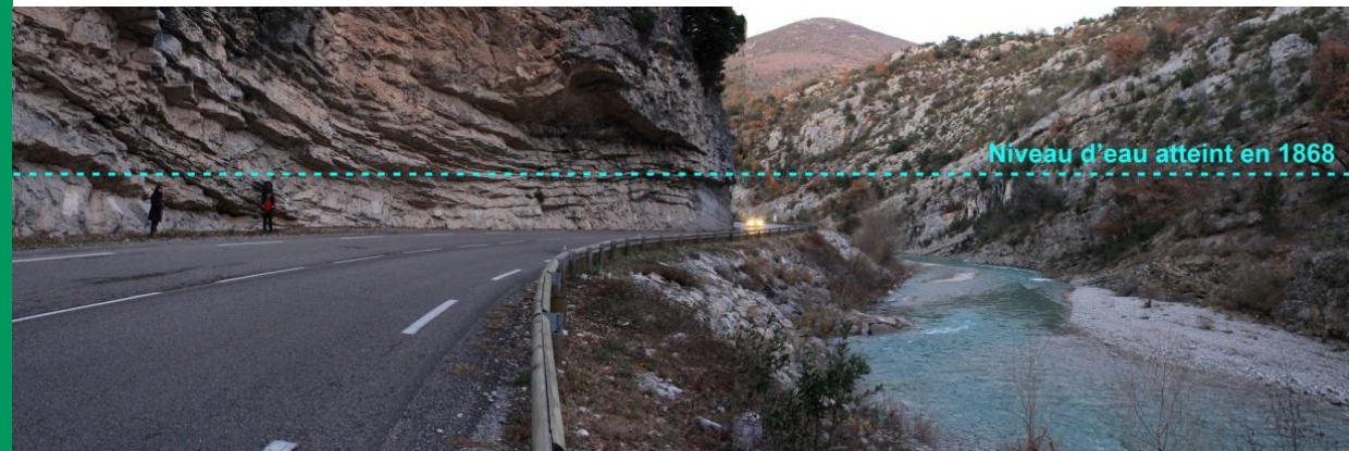
Niveau de la crue de 1868 dans les gorges de l'Eygues