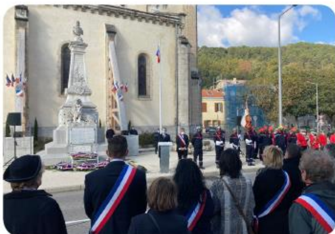
Commémoration du séisme du Teil le 11 novembre 2020.