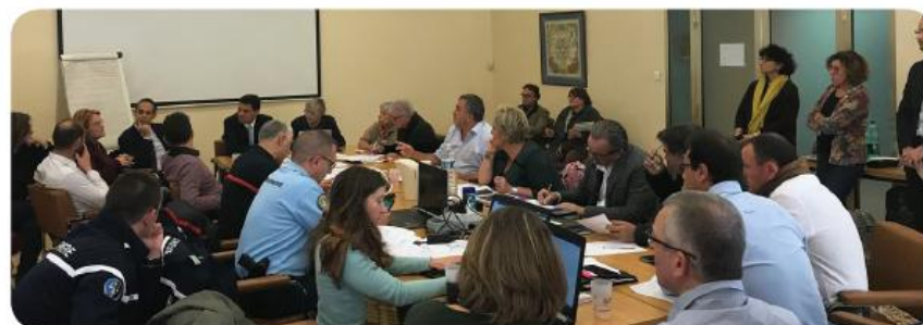
Le PCC en action