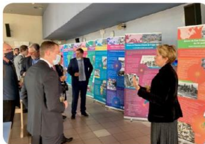
Exposition AFPS lors de la commémoration du séisme du Teil le 11 novembre 2020.