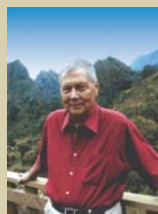
Paul Vergès, Président de l'ONERC