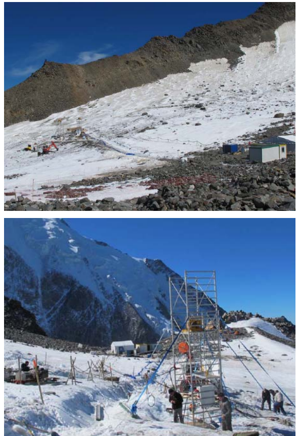
Fig. 35. Vidange artificielle de la poche par pompage entre le 25 août et le 15 octobre 2010