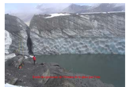
Fig. 36. Etude des processus de l'érosion de la glace par l'eau