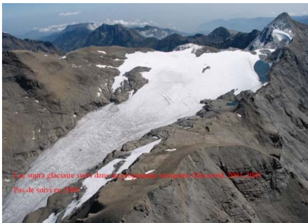
18 sept. 2004

terrain a permis d'identifier (juste à temps) un risque de débordement du lac (Fig. 38), qui a été par la suite signalé dans un rapport à la préfecture (17 sept. 2004). Du point de vue de la connaissance de l'aléa, « l'inventaire n'avait pas servi à grand-chose ». En effet, tous les lacs qui se forment ne sont pas nécessairement « à risques ».