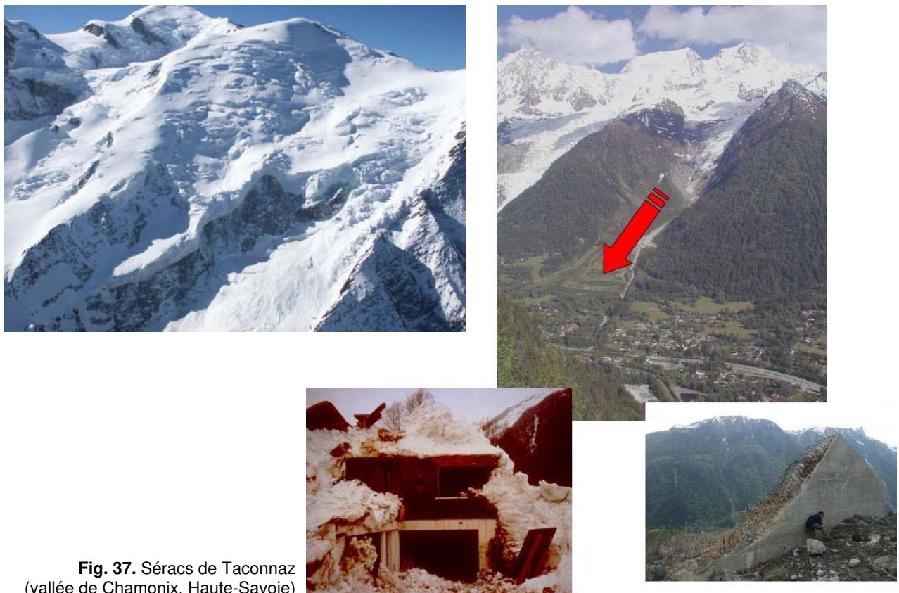
Fig. 37. Séracs de Taconnaz (vallée de Chamornix, Haute-Savoie)