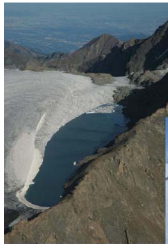
22 Août 2004