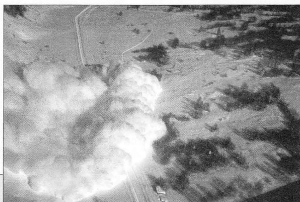
Avalanche déclenchée au col d'Ornon.