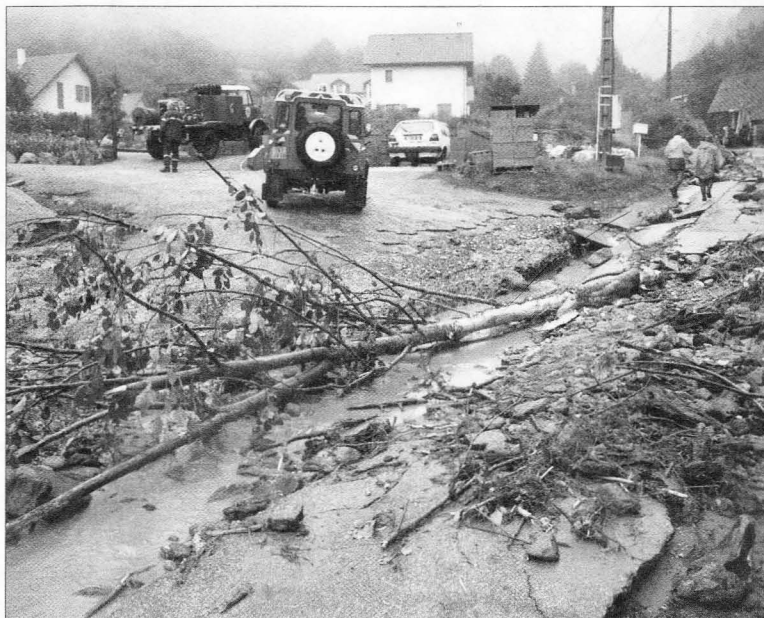
Débordements du Vorz au hameau de la Gorge (Communes de Sainte-Agnès - Saint-Mury), août 2005.

Jusqu'en 2010, le PARN a animé un programme de recherche départemental, financé par le conseil général de l'Isère, qui soutenait un certain nombre de projets isérois sélectionnés par son conseil scientifique. Ces études ont notamment