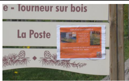
avec la population