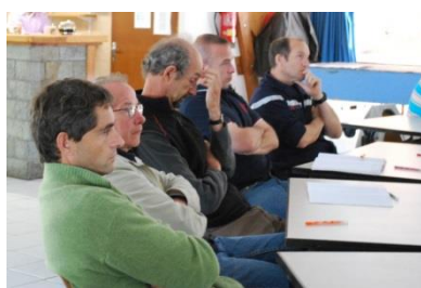
Réunion de restitution avec les institutions