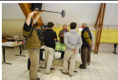
avec les médias