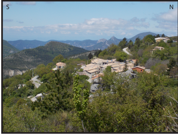
Photographie de la commune du Pöet-en-Percip, situé à quelques mètres sous le glissement de terrain

Localisation : La commune du Pöet-en-Percip est située sur la départementale D159 entre Buis-les-Baronnies et St-Auban-sur-l'Ouvèze