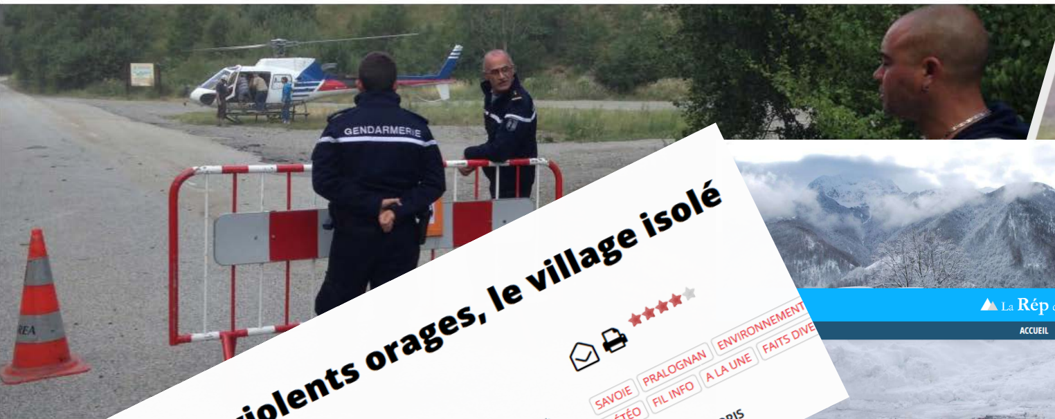
Depuis le 6 juillet