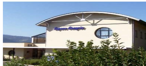
Domaine des fontaines-Bernin-Isère