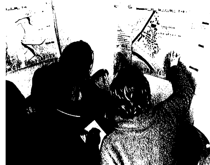
Les routes, les digues, les ponts sont une priorité

La Mission Gestion Intégrée des Risques Naturels travaille à la mise en place de cette nouvelle gestion, adaptées