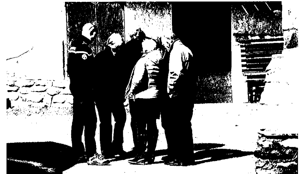
La population est prévenue par la gendarmerie et les agents municipaux des risques d'une évacuation éventuelle

Cette journée ensoleillée était placée sous le thème de la convivialité, de l'émotion, des souvenirs... Journée également couronnée par la victoire, contre Briançon de l'équipe de St Martin de Queyrières en compétition qui a ainsi honoré l'ancien Président.