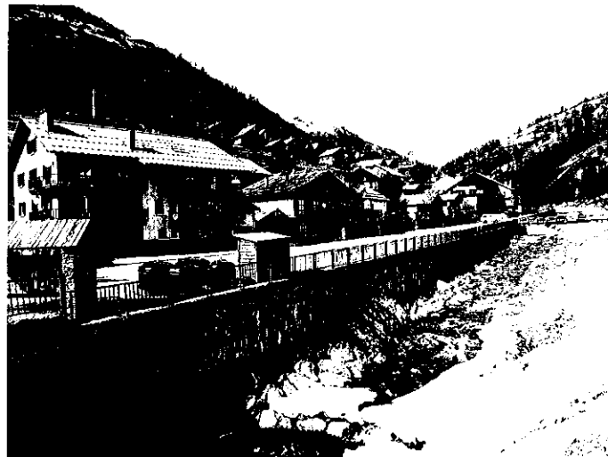
Les torrents qui encadrent Abriès, le Bouchet et la Garcine, tenaient les tères places dans ce jeu de rôles